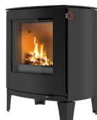
Ben H=165 mm