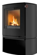
Sockel, standard H=280 mm